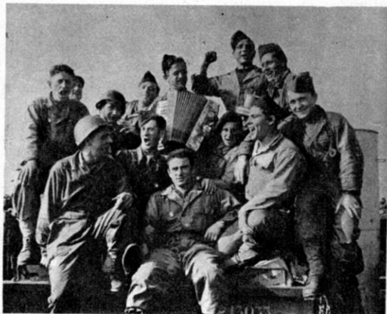
Une belle traversée: les refrains du régiment

Le major M. raconta en Angleterre l'histoire