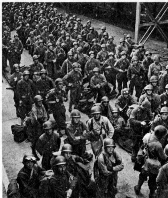
Les hommes attendent l'ordre d'embarquer