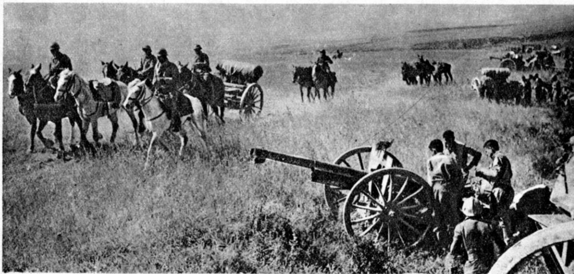
Tunisie, 1943: Victoires françaises déjà — mais le matériel est encore celui de l'autre guerre

"Après l'armistice" explique le colonel D.,