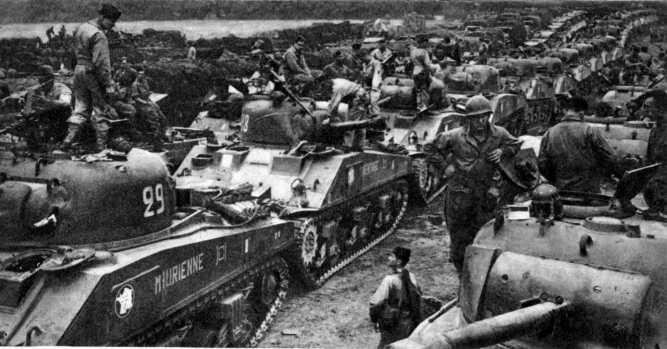
Aujourd'hui l'armement de la 2e D.B. surclasse tout ce que les Panzers ont mis en ligne dans cette guerre

ancien méhariste, on a commencé à se battre avec les quelques vieilles seringues françaises qui nous restaient. On a emprunté immédiatement du matériel un peu plus moderne aux Italiens, en leur faisant sauter quelques portes. Ensuite, on a eu un apport de matériel anglais et, mon Dieu, on a fait les campagnes du Fezzan, de Tripolitaine, de Tunisie avec ce matériel. Pour la campagne de Tunisie on a été équipé définitivement en division blindée avec du matériel américain entièrement neuf.”